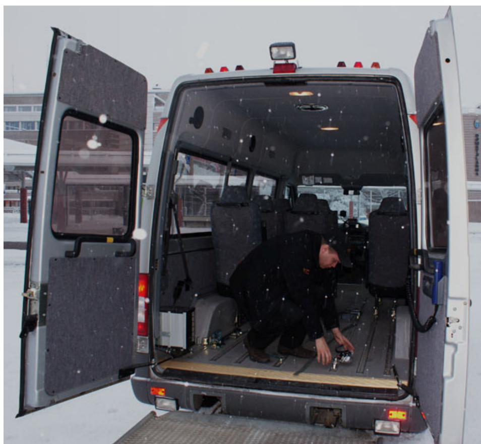
Bild 1. Interiör för ett specialfordon, föraren håller på att ta lös spännbanden från fästena på golvet sedan rullstolen har körts ut från fordonet..

De fordon som används inom färdtjänsten är dels vanliga taxibilar för transporter de flesta färdtjänstresenärer med lättare rörelsehinder och dels specialfordon, bild 1, för personer med större rörelsehinder som sitter i rullstol.